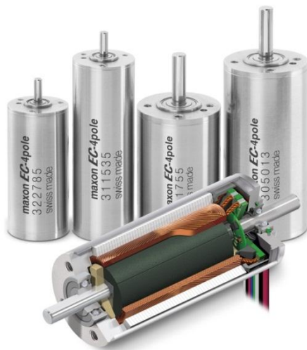
Abbildung 4: Die maxon EC-4pole Produktfamilie.