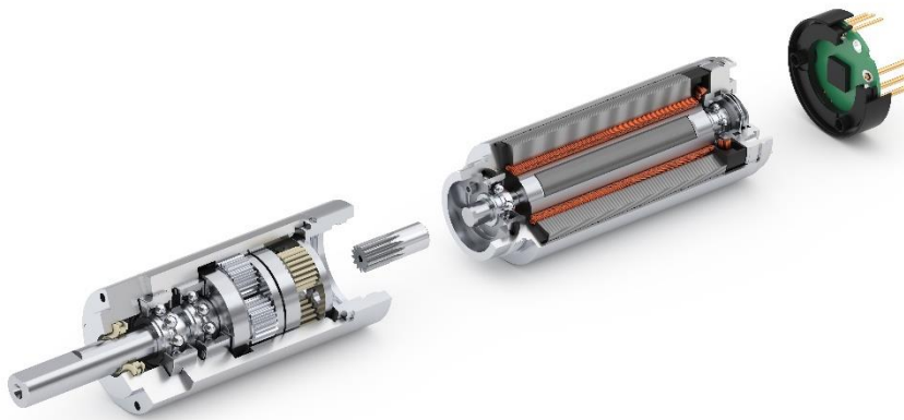
Sterilisierbares Antriebssystem mit BLDC-Motor, Getriebe und integriertem Encoder.