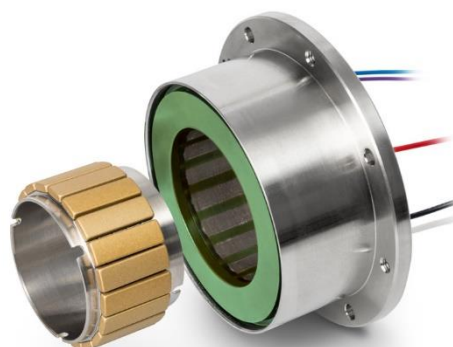
Le EC frameless DT65 à grand arbre vide.