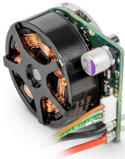
Le nouvel ECX FLAT 32 à électronique intégrée.